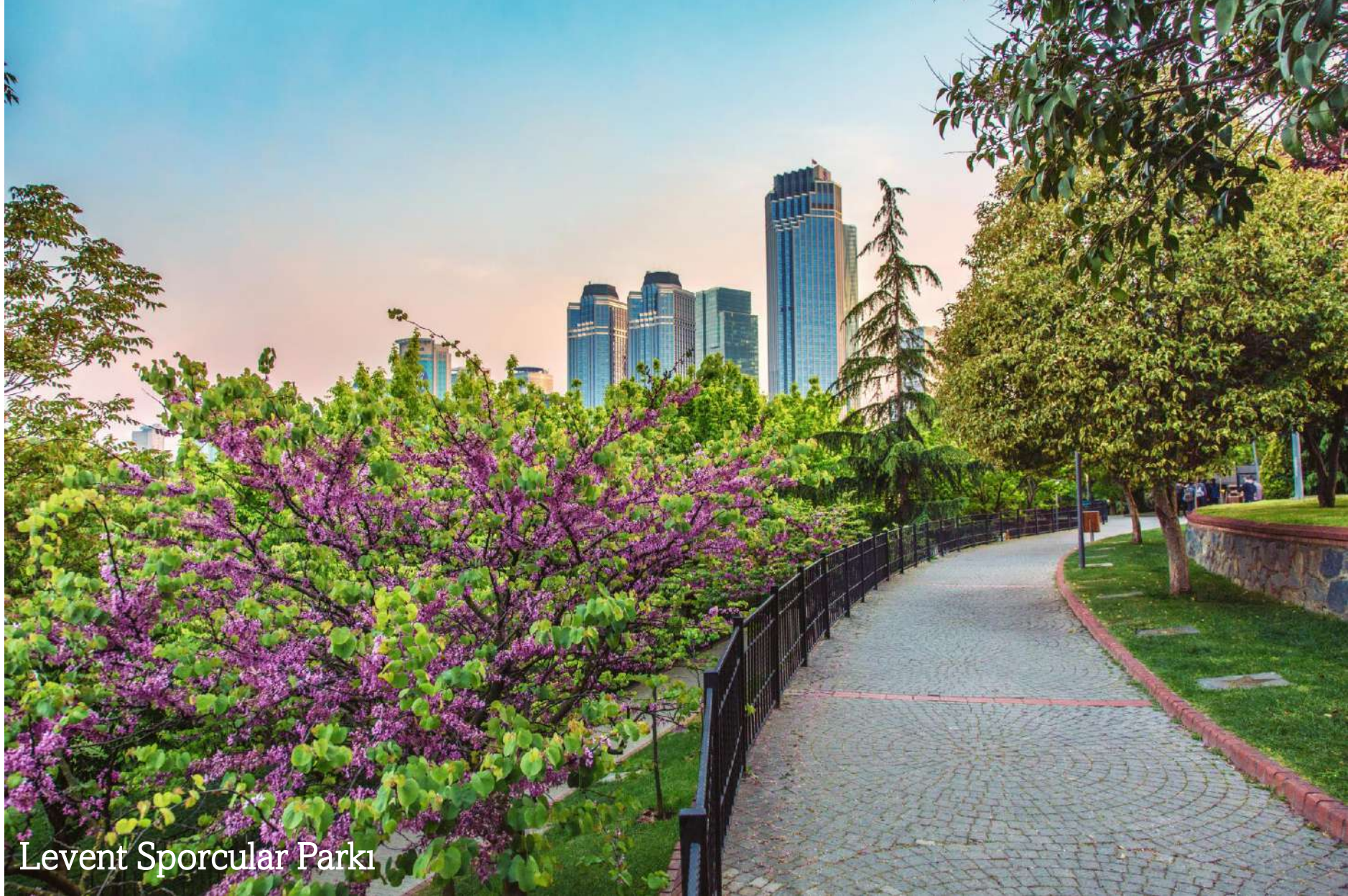
Levent Sporcular Parkı

Şehrin en önemli noktalarından birinde, zengin geçmişi, kültürel atmosferi ve ayrıcalıkları ile kent hayatı için vazgeçilmez olmalı