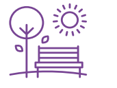
حديقة عامة Community Park