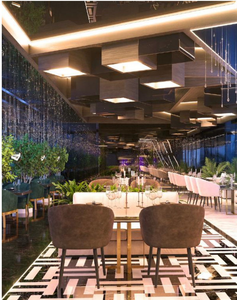
Ресторан на 4 этаже