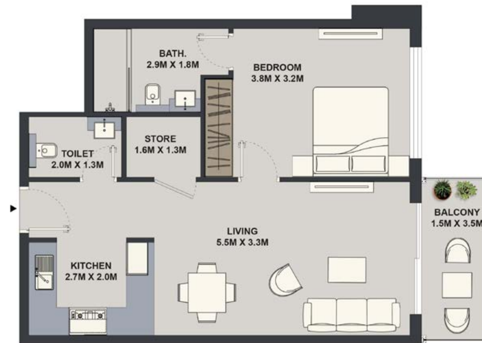
1BHK - TYPE 1