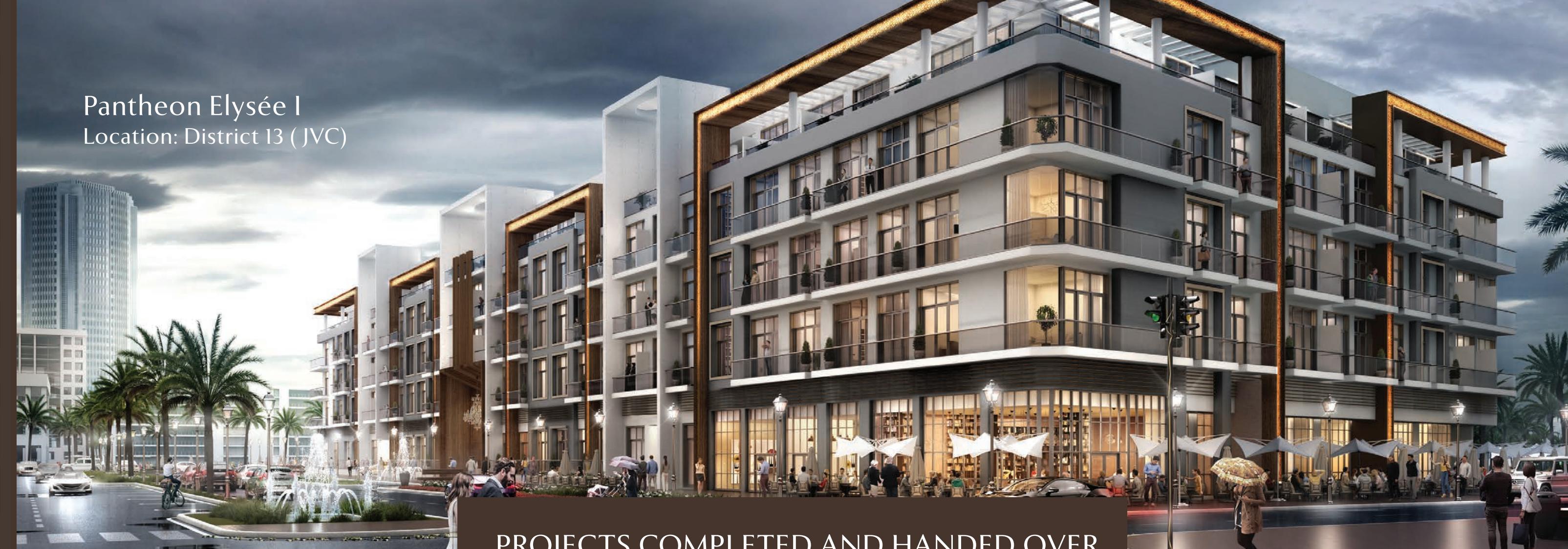
Pantheon Elysée I Location: District 13 (JVC)