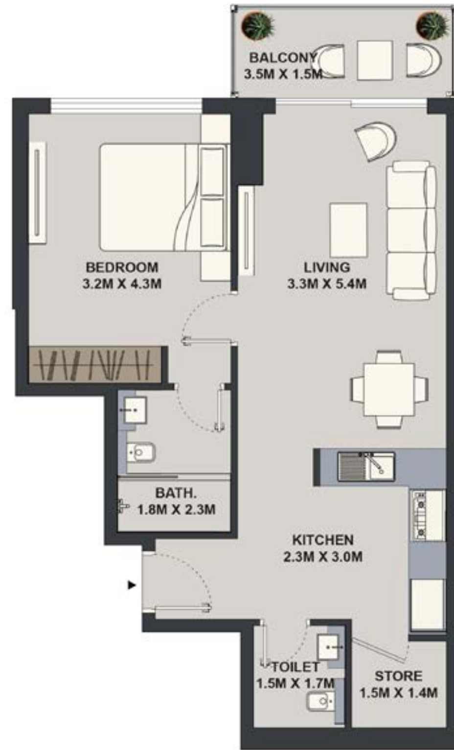
1BHK - TYPE 3