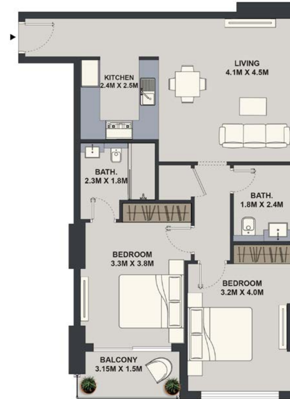
2BHK - TYPE 1