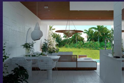
Green Flow Villa 21