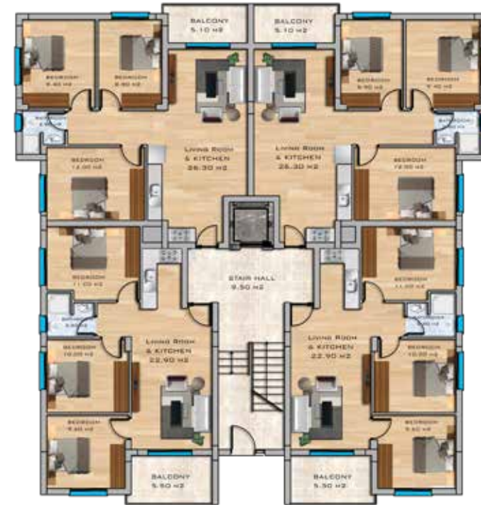
3+1 Apartments Ground Floor Plan