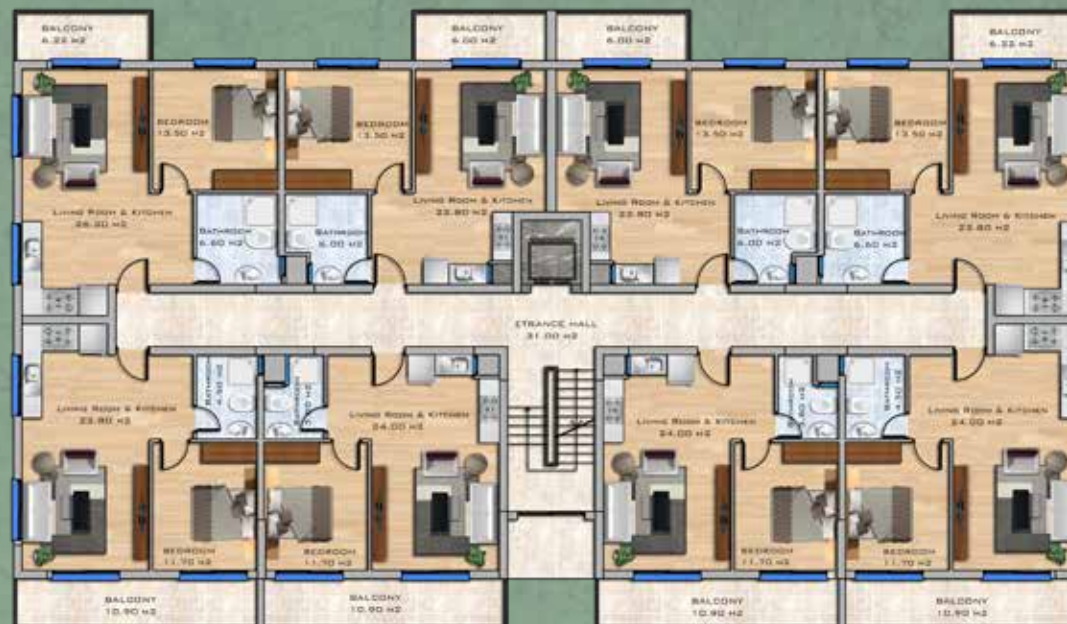
1+1 Apartments First Floor Plan