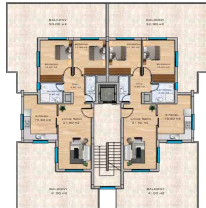
Penthouse Floor Plan