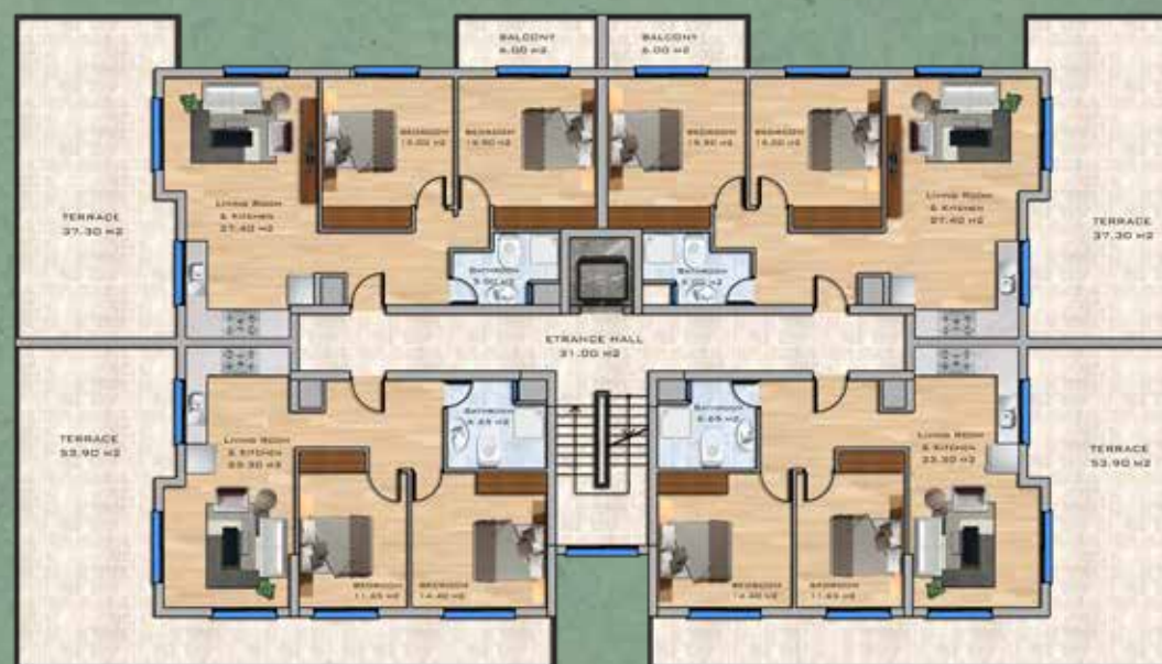
Penthouse Floor Plan