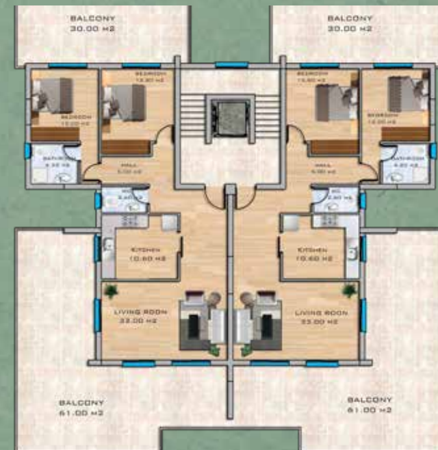
Penthouse Floor Plan