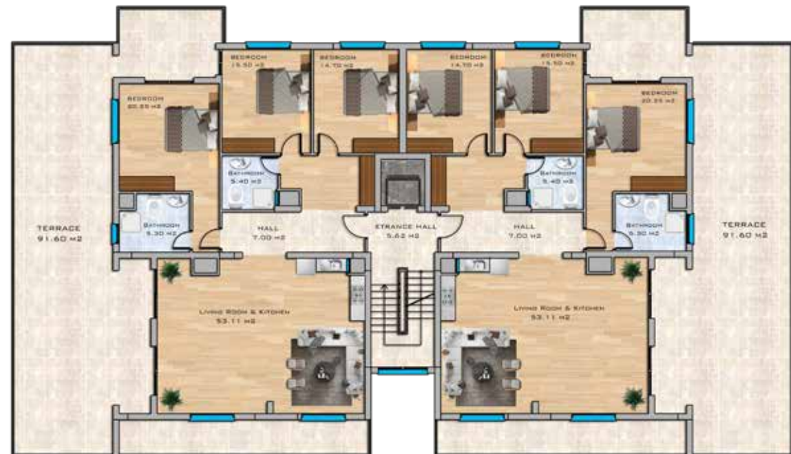
Penthouse Floor Plan