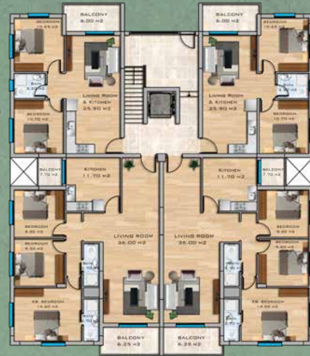
2+1, 3+1 Apartments Ground Floor Plan