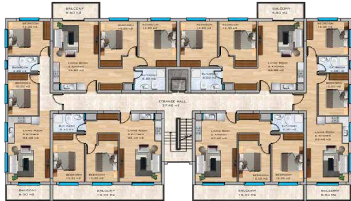
2+1 Apartments First Floor Plan