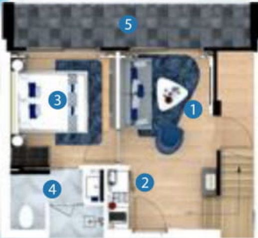
1st floor plan