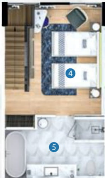
2nd floor plan