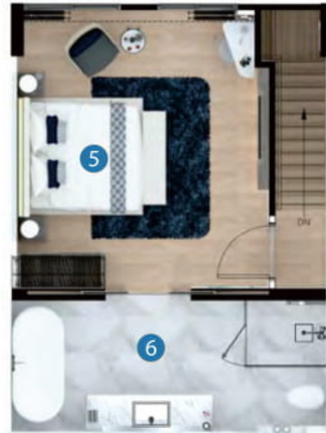
2nd floor plan