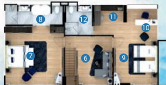
2nd floor plan