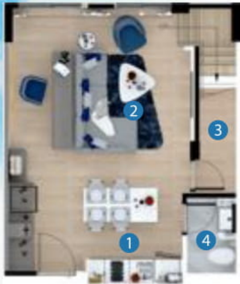
1st floor plan