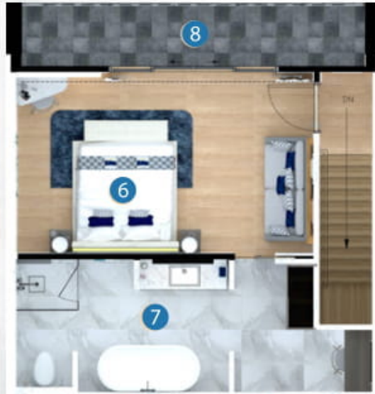
2nd floor plan