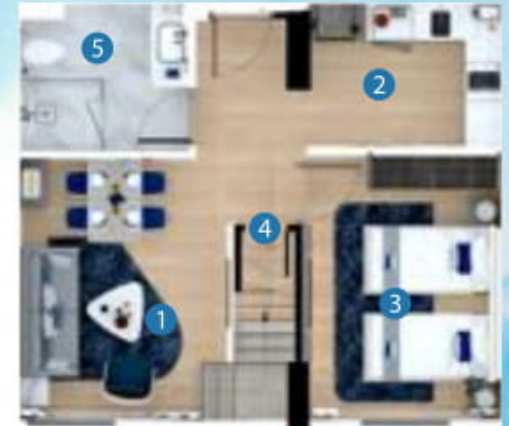
1st floor plan