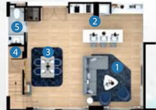
1st floor plan