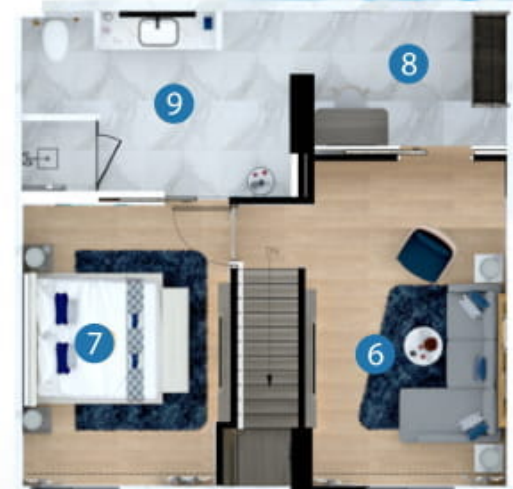
2nd floor plan