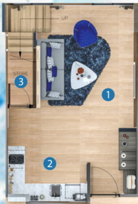
1st floor plan