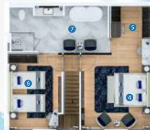
2nd floor plan