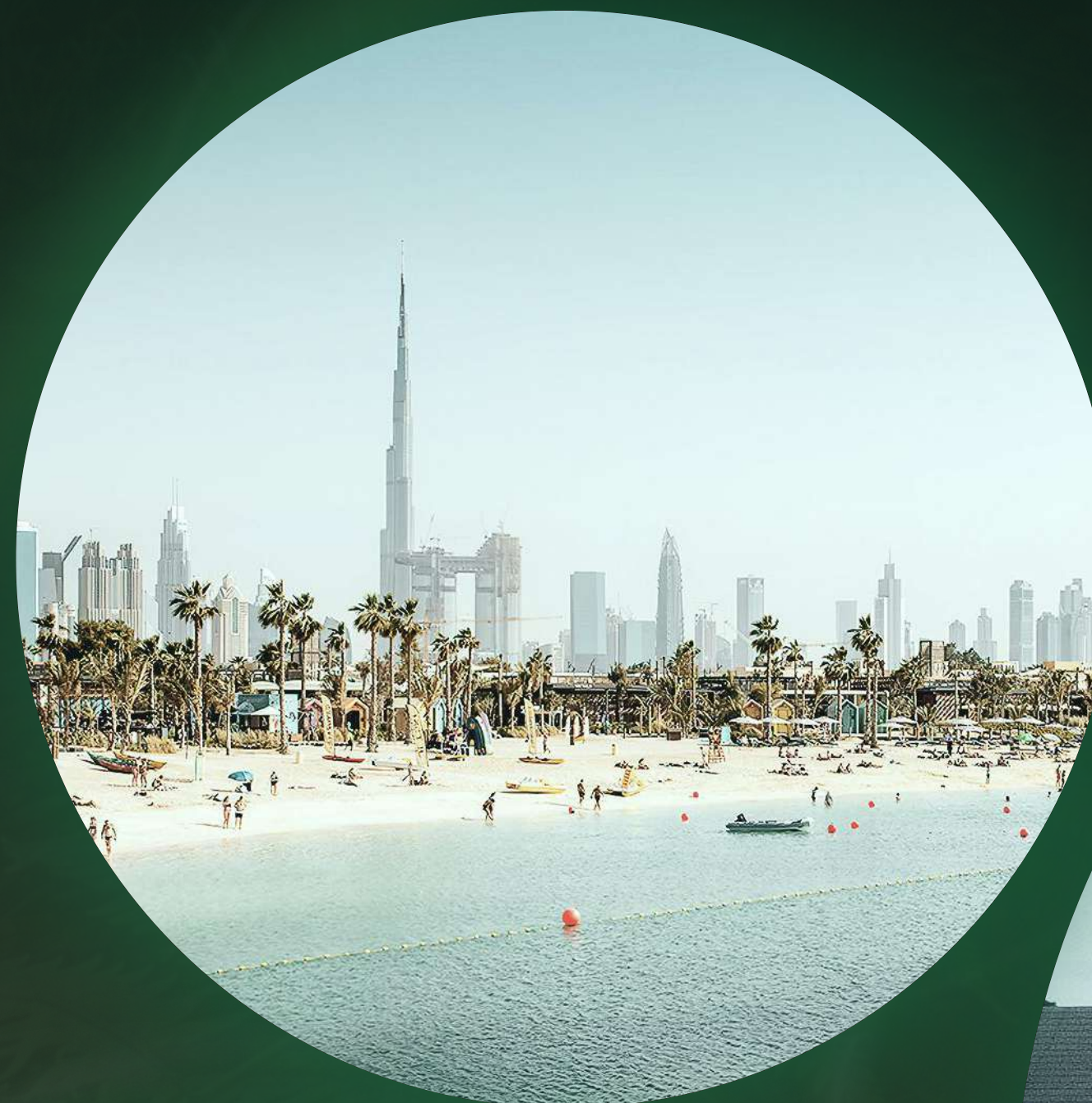
LA MER BEACH