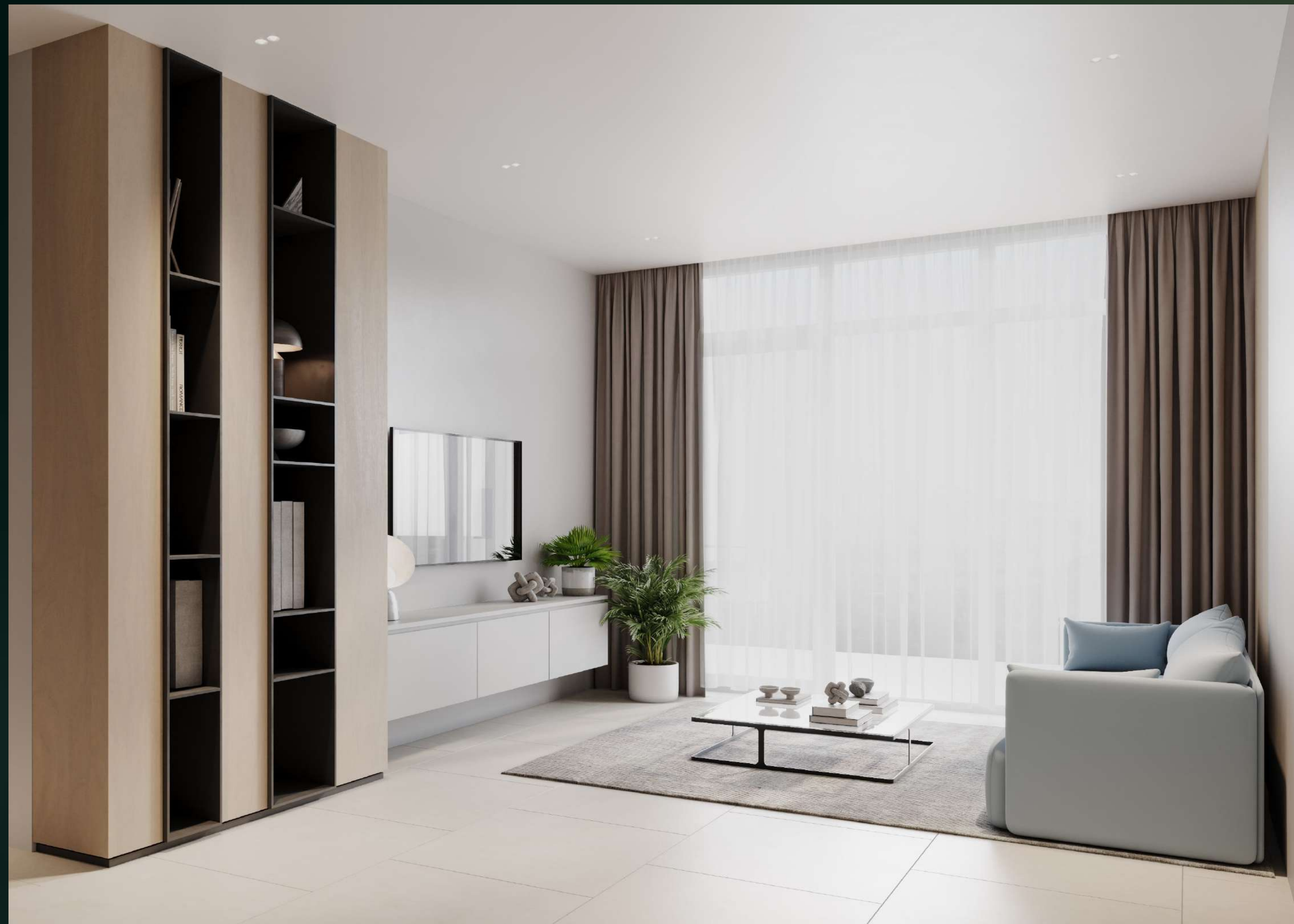
Апартаменты TWO BEDROOM / ГОСТИНАЯ / КУХНЯ