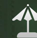
LA MER BEACH