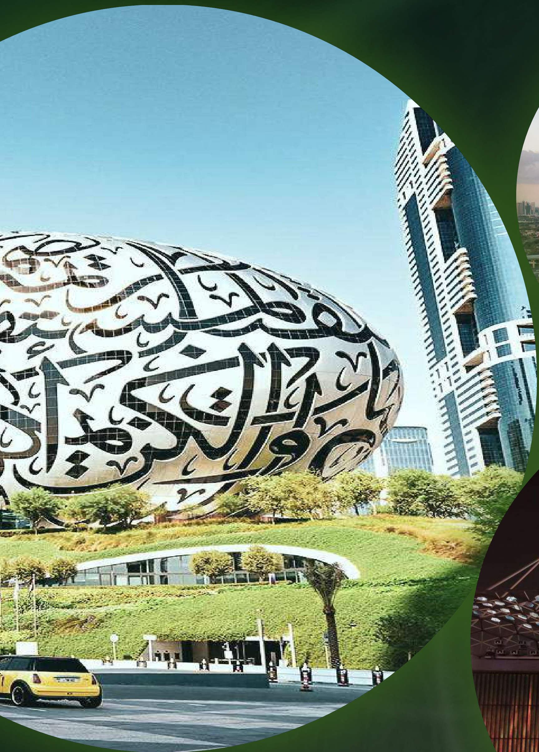
MUSEUM OF THE FUTURE