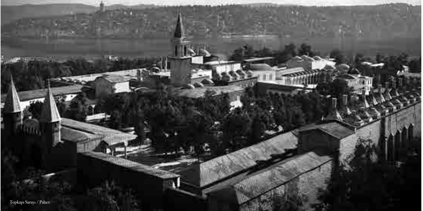
Topkapı Sarayı / Palace