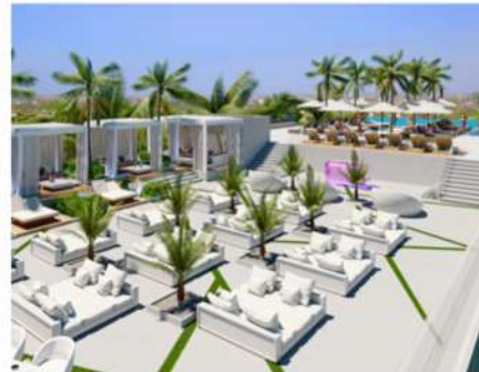
Rooftop лаундж зона с баром, джакузи и лежаками