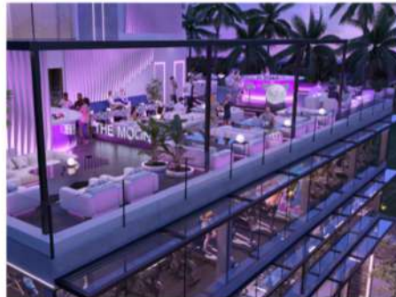
Lounge bar в футуристичном стиле