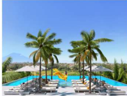
Самый высокий инфинити бассейн на Бали