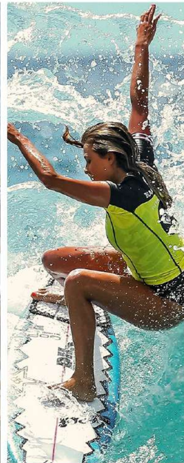
Лучшие сёрфинг-споты 7 минут