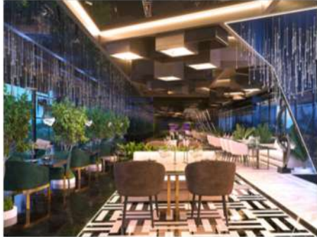
Ресторан с фьюжн кухней

КОМПЛЕКСА THE UMALAS SIGNATURE, К КОТОРОЙ БУДЕТ ДОСТУП У ВАС И ВАШИХ ГОСТЕЙ