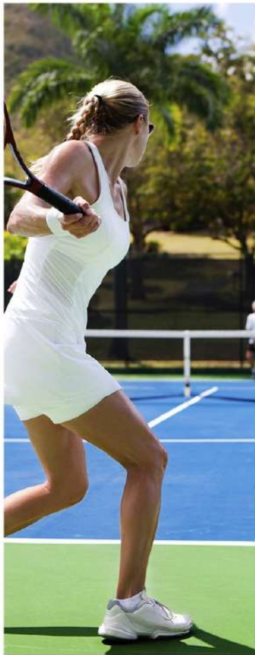
Теннисный корт Liga.Tennis (самый большой на Бали) 3 минуты