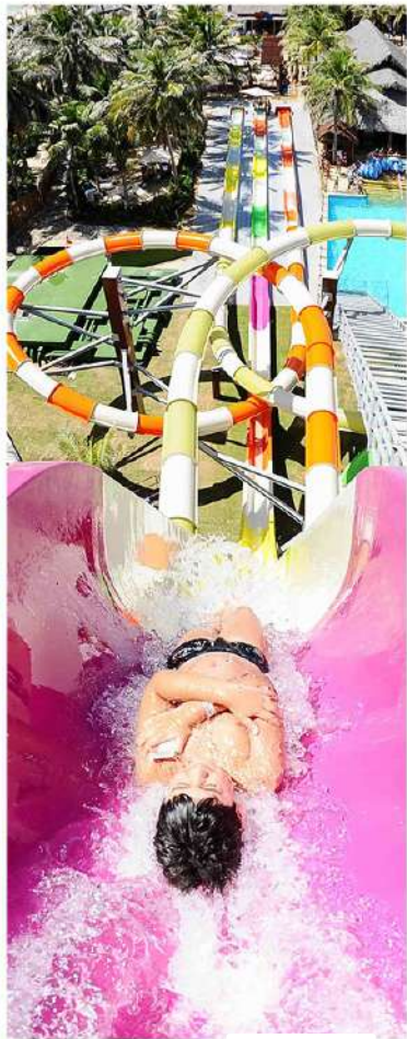
Аквапарк - 4 минуты