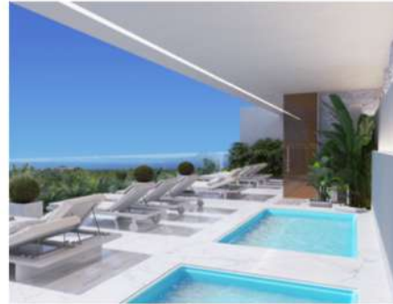
СПА зона с панорамным видом