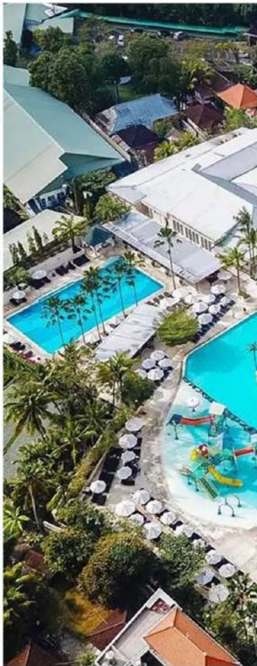
Крупнейший спортивно развлекательный комплекс 4 минуты