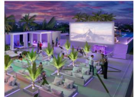
Кинотеатр под открытым небом